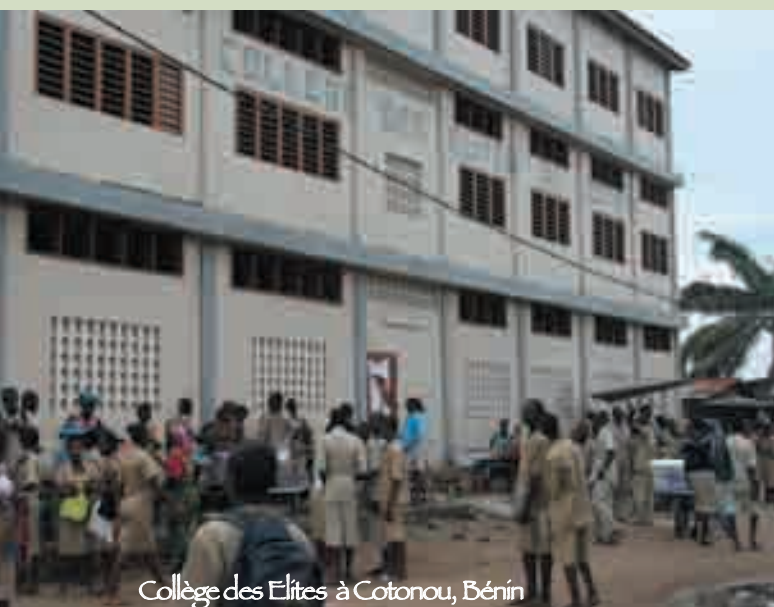
Collège des Elites à Cotonou, Bénin