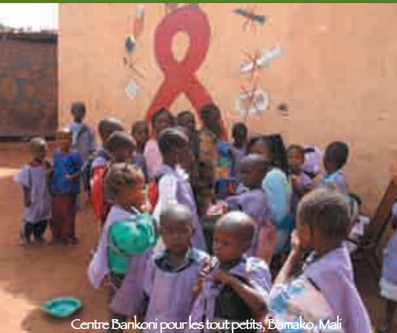
Centre Bankoré pour les tout-petits, Bamako, Mali

Les pays africains au sud du Sahara, notamment dans l'ouest, restent cependant de reconnaissance limitée au regard des objectifs de l'Éducation pour tous.