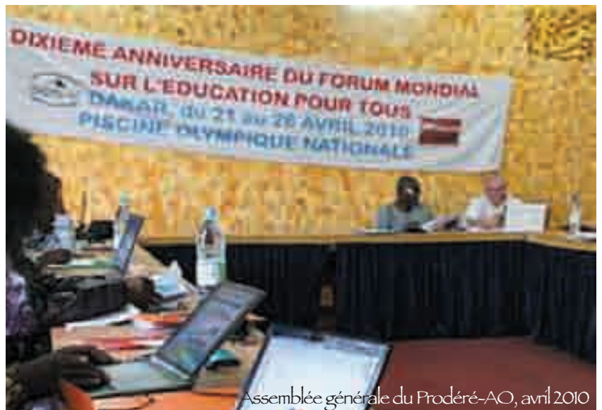
Assemblée générale du Proderé-AO, avril 2010

* Bénin, Burkina Faso, France, Mali, Niger et Sénégal