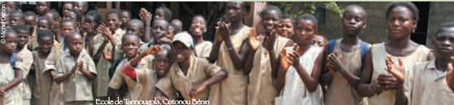
Ecole de Tannougola, Cotonou Bénin