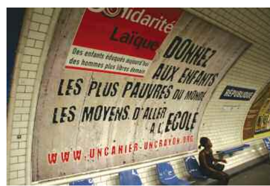
Campagne dans le métro parisien. Les emplacements ont été offerts par la RATP. Été 2009