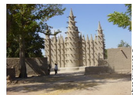
La mosquée de la région de Djenné

La religion majoritaire au Mali est l'islam, religion de 90% de la population malienne, 9% de la population est animiste et le christianisme touche 1% de la population malienne.