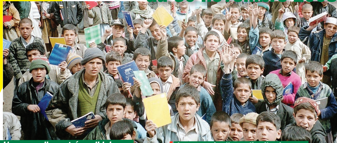
Distribution de fournitures scolaires en Afghanistan