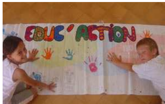
Educ'action dans un centre Vacances Pour Tous à Port Barcarès

Outils disponibles : un dossier d'animation avec des fiches pays sous forme de CD-Rom pour les animateurs.