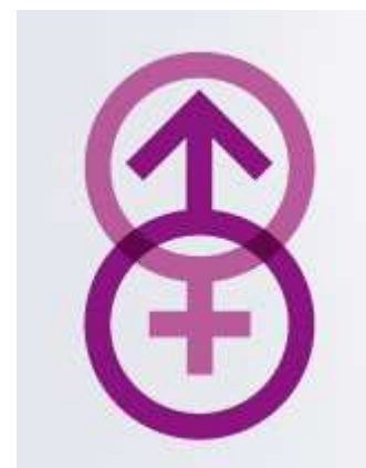
Visuel de la campagne du ministère des Affaires étrangères et européennes « Huit fois oui ».

Dans trop de pays, les filles sont des laissées pour compte. Parmi les nombreux avantages qu'offre un enseignement de qualité, il y a la sécurité qui s'attache au travail rémunéré. Or, les femmes sont trop souvent reléguées dans des emplois précaires et mal payés.