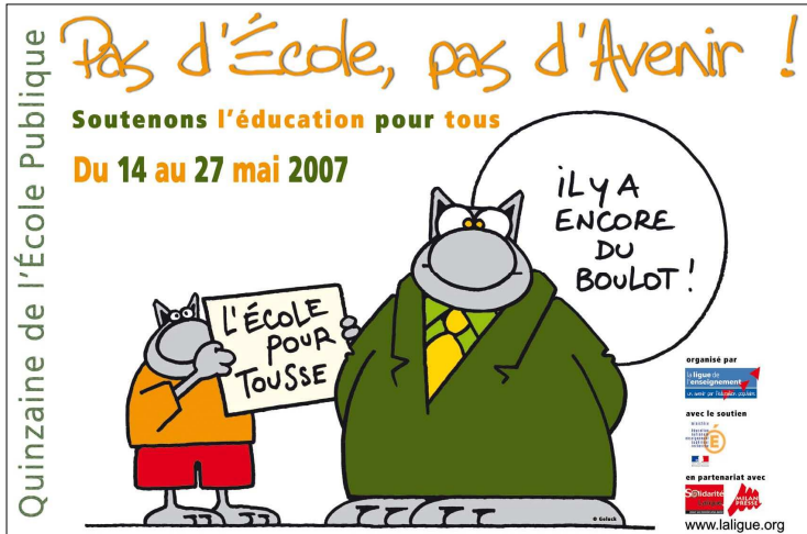
Quinzaine de l'école publique 2007 pour l'Éducation dans le monde