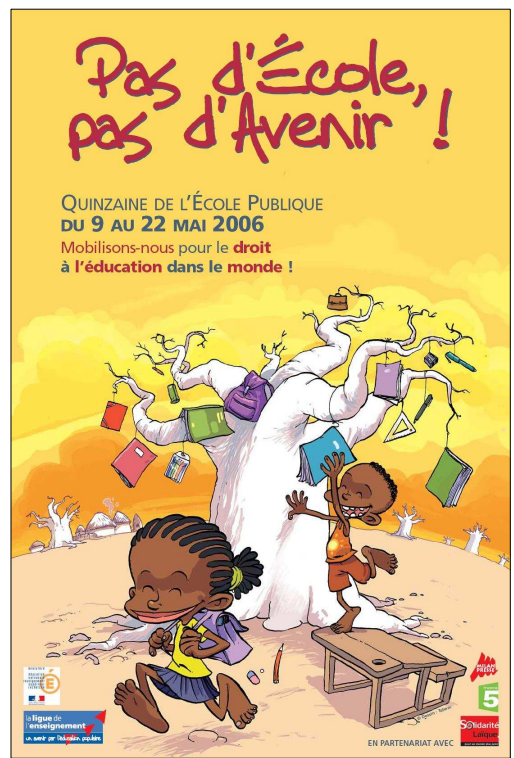
Quinzaine de l'école publique 2006 pour l'Éducation dans le monde