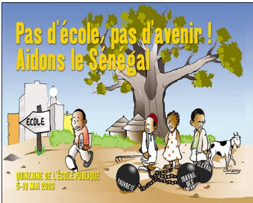
Quinzaine de l'école publique 2003 pour le Sénégal