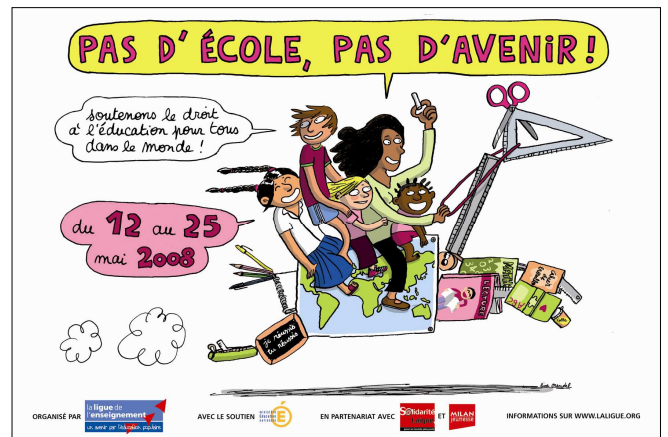
Quinzaine de l'école publique 2008 pour l'Éducation dans le monde