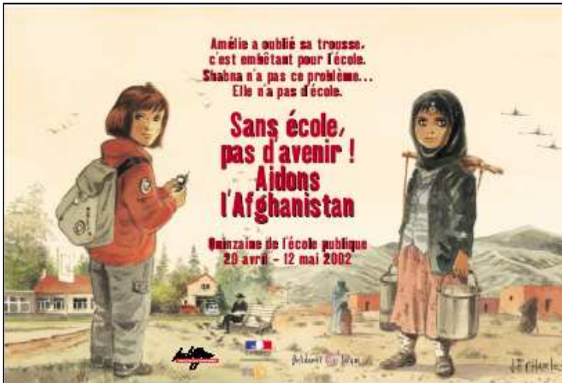
Quinzaine de l'école publique 2002 pour l'Afghanistan

A partir des affiches de la Quinzaine de l'école publique - "Pas d'école, pas d'avenir !"*