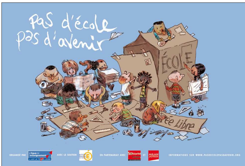
Quinzaine de l'école publique 2009 pour l'Éducation dans le monde