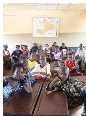
59% des enfants non scolarisés sont des filles