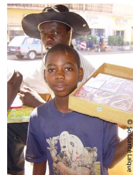
Le travail des enfants, un obstacle à l'éducation

Le travail des enfants peut prendre plusieurs formes : petits boulots dans les villes, travail en tant que domestique ou ouvrier, corvées domestiques pour les filles etc. Ces données accentuent davantage les inégalités dans l'accès à l'éducation, puisque les enfants des familles riches ont beaucoup plus de chances d'être scolarisés.