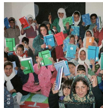
Afghanistan : des écolières reçoivent leurs fournitures

L'opération a permis à des milliers d'élèves et d'enseignants de découvrir d'autres pays, d'autres cultures grâce aux dossiers et aux outils pédagogiques (DVD Rom, poster...) proposés. Elle a été un moyen de sensibiliser les plus jeunes et leurs parents à la solidarité internationale à travers des milliers d'animations, notamment dans les établissements scolaires.