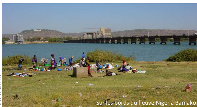
Sur les bords du fleuve Niger à Bamako