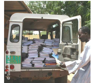
La distribution au Niger - 2006

Le matériel scolaire collecté et les dotations financières seront envoyés et distribués aux associations partenaires de Solidarité Laïque au Mali en lien avec les autorités pédagogiques du pays.